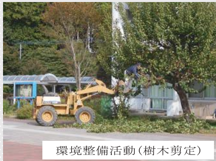
環境整備活動(樹木剪定)

整った環境を整え、教職員による業務の軽減を図る。また、地域の方々のボランティア活動の拡大を図り、子どもたちの成長と学校、地域の発展を目指したいと考えています。是非学校に足をお運びいただき、子どもたちに寄り添っていただければ幸いです。ご連絡をお待ちしています。