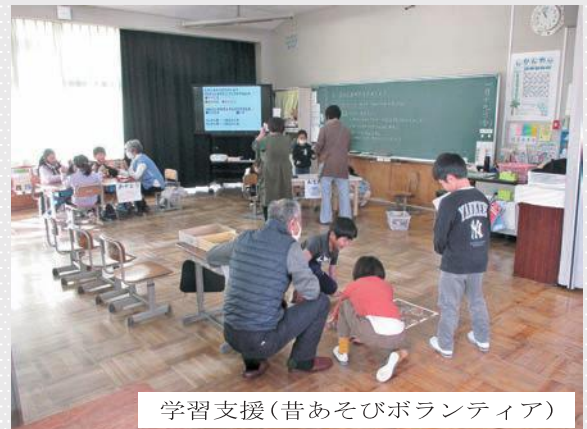
学習支援(昔あそびボランティア)

年間を通り、登下校の見守りや生活科の町たんしんのサポート、読み聞かせ等、多くの支援をいただいています。