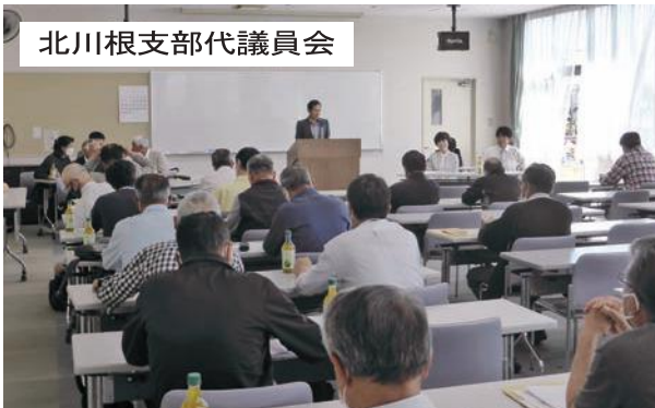
北川根支部代議員会

発行日 2024(令和6)年 6 月 20 日 発行集刷 笠間市社協北川根支部 編集刷 北川根支部広報委員会 印刷 (有)シーエス