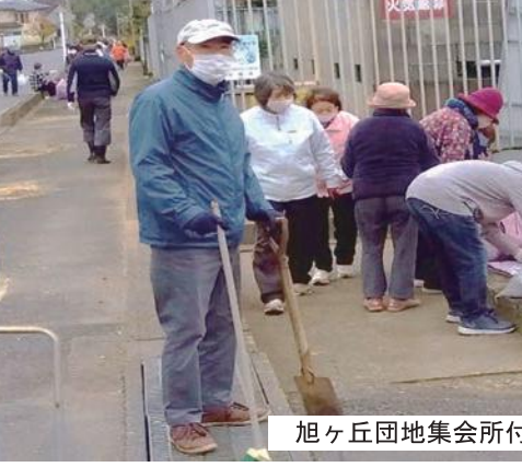
旭ヶ丘団地集会所付近