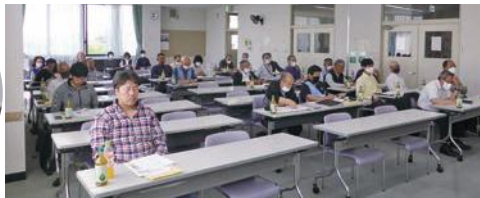
左 午後 右 午前の代議員会