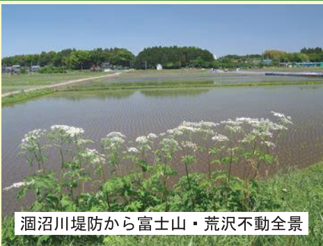
酒沼川堤防から富士山・荒沢不動全景

工業団地内に整備された石塚街道（県道石岡城里線）バイパスの南側への延長工事が進んでいます。仁吉田・長兎路地区の水田から工事が進んで、高台の荒沢不動のある富士山の西側を通る予定です。消防分団の機械置場の西側の道路が千数百年後の今に残る古代の官道跡（奈良時代）で、交差する形で工業団地内に北上して繋がることとなります。富士山には、荒沢不動が祀られており、荒沢不動七つ池があったと云われ、農業用水としても活用されてきました。一部の池敷は、消防分団の機械置場などが設置され、七つを数えることはできません。仁吉田地