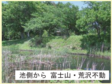
池側から 富士山・荒沢不動

「荒沢不動」は、水・田・漁業の神として信仰されているとのことです。各地に富士山や富士塚などがあり、富士信仰の広がりがもうかがえます。「荒沢不動」の創立は定かではありませんが、東の「於伊都岐（おいつぎ）神社」の不動明王（江戸時代初期・一六七九・延宝7年）、境内社に「富士神社」があり、仁吉田地区の東西の入口に祀られ、地区住民の拠り所となってきました。