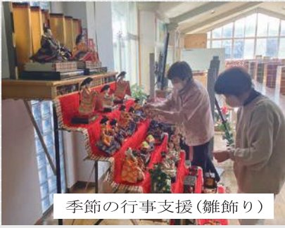
季節の行事支援(雛飾り)

この他にも学校・学年行事支援として、水泳の見守りや生活科の町たんしんのサポート、読み聞かせ等、多くの支援をいただいています。