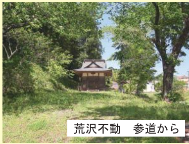
荒沢不動 参道から

域の皆様の環境を整備するために、花や野菜の植えつけ、魚の釣り大会などが開催されました。